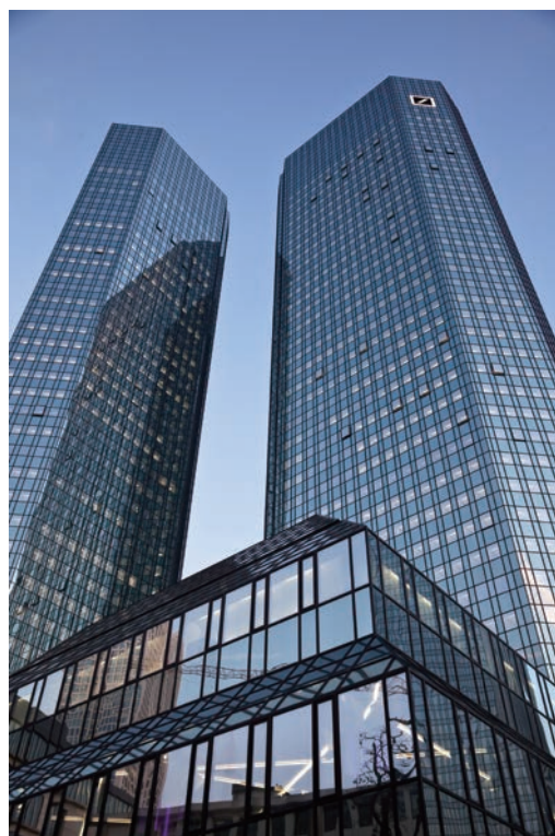
ドイツ銀行本社(ドイツ・フランクフルト)