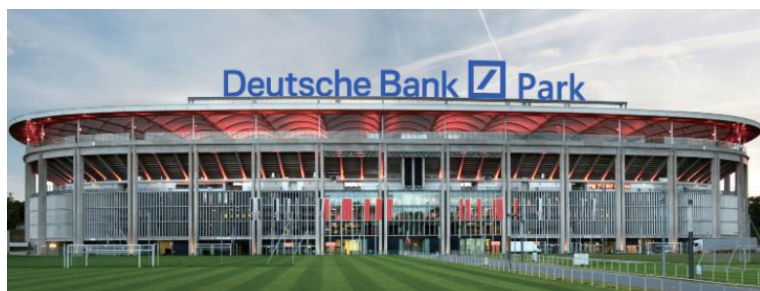
アイントラハット・フランクフルトの本拠地のドイチェバンクパーク

また、1872年(明治5年)、ドイツ銀行初の海外拠点として横浜と上海に支店を開設して以降、アジアでのビジネスは2022年に150周年を迎えました。